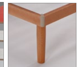
angoli giuntati con guarnizione in gomma anti urto