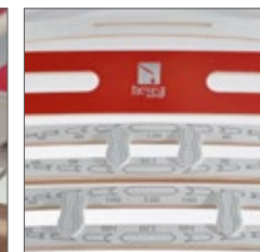
regolatori di peso zona bacino