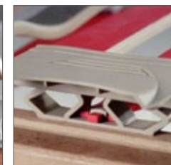
doga lombare con meccanismo di regolazione lordosi