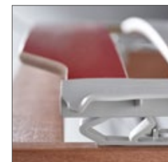
supporti basculanti in Sebs

Le immagini in assenza del materasso evidenziano le caratteristiche positive di SALUS : si nota come le sospensioni flessibili si adattano ai contorni del corpo, seguendo le sue curve e in corrispondenza della regione lombare sostengono la lordosi, mentre la rete troppo morbida e cedevole altera le curve fisiologiche, il telaio con sospensioni indipendenti, regolatore della curva della lordosi consente un confort ottimale, un allineamento corretto della colonna vertebrale con la possibilità di adattare il letto alle esigenze specifiche di ogni soggetto.